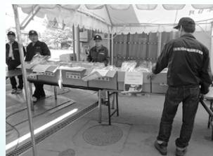
避難所にて衛生用品の配布(山西小学校)