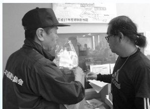
食品衛生指導員による衛生用品説明と衛生指導(広安西小学校)

第4便 ●熊本県支部 手洗い石けん、アルコールスプレー、嘔吐物処理キット、次亜塩素酸ナトリウム泡スプレータイプ