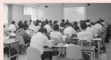
講義初日、気合十分です(東京会場)

「平成29年度食品衛生管理者の登録講習会(添加物)」は、昨年度同様、東京都の登録を受け、下記のとおり実施いたしました。北海道から沖縄県まで、2会場合わせて75名が参加され、全員が修了されました。本講習会は、約2か月間にわたる、講義、施設見学、実習および試験を下記の科目、時間数で実施いたしました。(公益事業部 松本 奈見子)