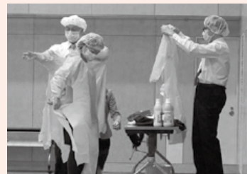
正しい着衣を実際に体験