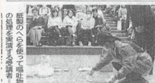
北陸中日新聞提供(H29.11.14朝刊) ※記事より一部抜粋

ノロウイルス防げ 汚物処理など学ぶ 県内の協同講習会 冬から春先にかけて猛威を振るうノロウイルスによる食中毒を防ぐための講習会が十三日、金沢市鞍月の県地場産業振興センターであり、県内の飲食店従業員や介護福祉士ら約百二十人が予防法や汚物の処理方法などを学んだ。