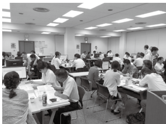
白熱したグループ討議が行われています

2019年度もHACCPの義務化に向けて、HACCPの円滑な導入・運用できる人材を育成するための研修会を4~7月の間に、下記のとおり開催いたします。皆さまのご参加を心よりお待ちしております。