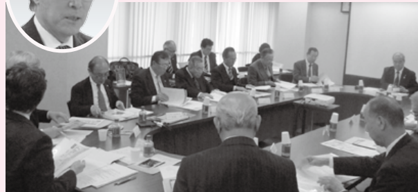
議長を中心に会議が進みます

たる検討を行い、もって業界の発展ならびに国民の健康増進に資することを目的としております。