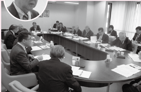
活発な意見交換が続きました