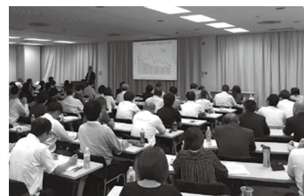
どの研修会も多くの方に参加いただいています