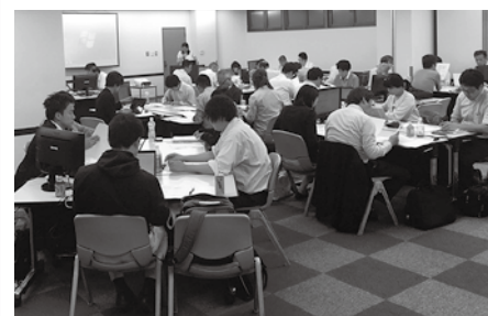
いつも活発なグループ討議