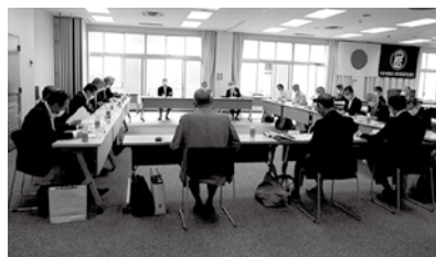
意見交換会では支部の現状を共有