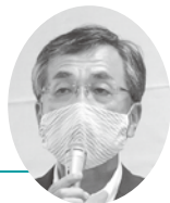
小熊副理事長 (新潟県支部長)