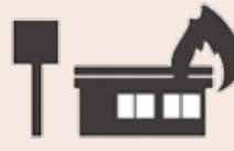
店舗火災による現金焼失