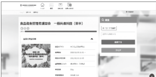
eラーニングの専用サイト画面

全講習が無事に修了した際は、皆さま晴れ晴れとした表情をされておりました。当講習会を修了された皆さまの食品衛生管理者としてのご活躍を期待しております。