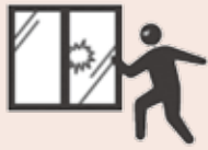
営業時間終了後の 店舗侵入・現金盗難