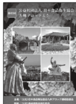
九州ブロック大会