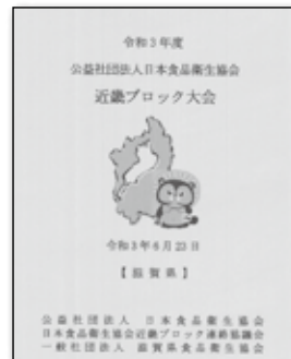
近畿ブロック大会