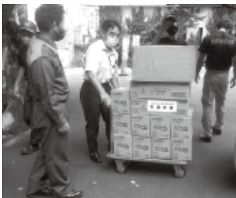
熱海市での物資運搬の様子

令和3年7月に静岡県内で発生した豪雨災害により被災された皆さまに心よりお見舞いを申し上げます。日食協では、被災地域食品衛生協会からの要請に基づき、アルコール、手袋等の衛生関係用品を提供し、地区食品衛生協会の役職員や食品衛生指導員より配布いただきました。