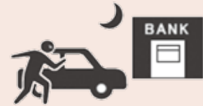
銀行夜間金庫への輸送時、 施錠した自動車内からの現金盗難