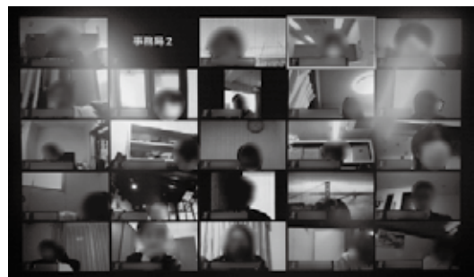
ライブ形式の集合研修の様子 (パソコンの画像上に受講者の顔が写る)