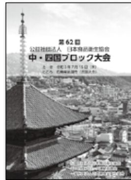
中・四国ブロック大会