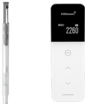
<ルシパックA3> <ルミテスター Smart>

なお、下記一覧に掲載の頒布品は頒布先を全国の食品衛生協会及び食品衛生関係行政機関に限定しております。何卒ご了承くださいますようお願い申し上げます。