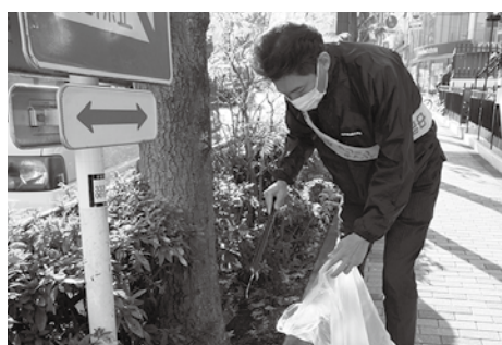
商店会主催の美化活動にも積極的に参加