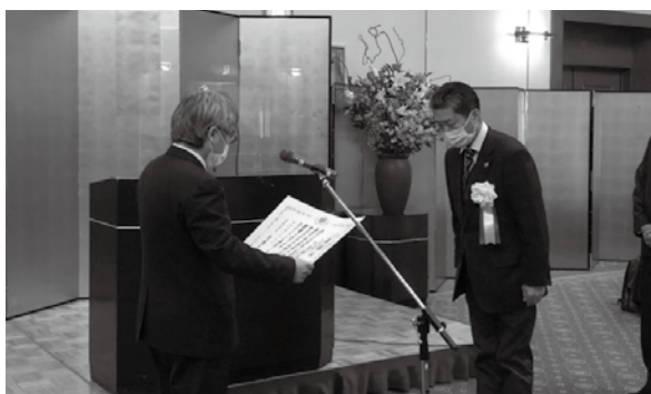
天野食品安全参事より表彰状を授与