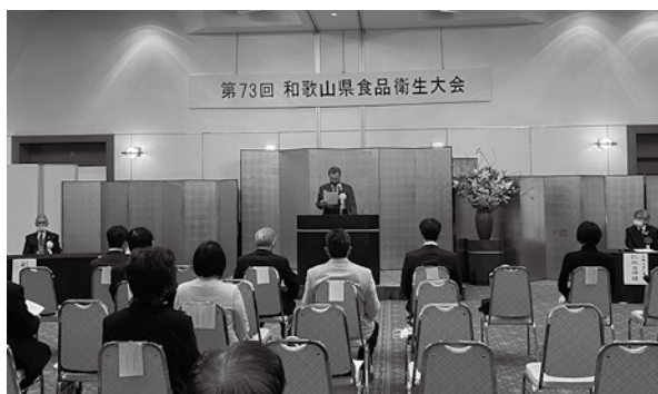
密にならないように対策して開催