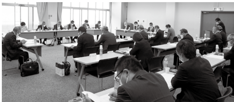
日食協理事会の様子