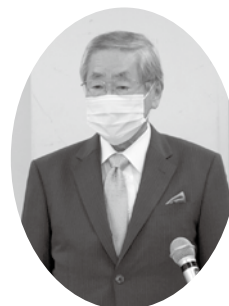
鵜飼理事長による 開会あいさつ