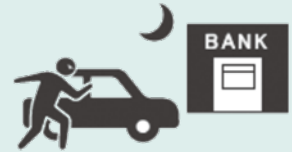
銀行夜間金庫への輸送時、 施錠した自動車内からの現金盗難