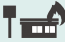
店舗火災による現金焼失