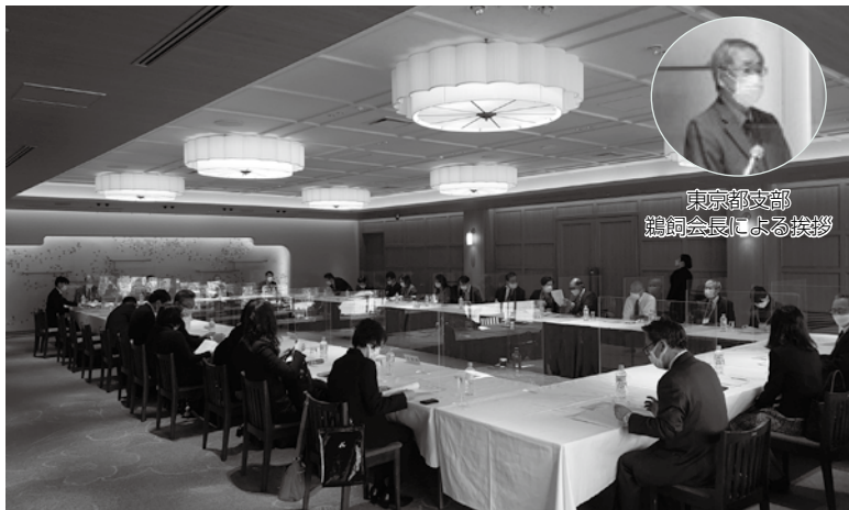
東京都支部 鷗飼会長による挨拶

当連絡協議会は、日食協と検査機関を運営する支部(東京都、埼玉県、山梨県、長野県、愛知県、大阪、広島市、高知県、長崎県)で構成されており、各機関が直面する技術的な諸問題についての