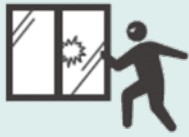
営業時間終了後の 店舗侵入・現金盗難