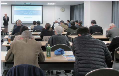
講義「ノロウイルス食中毒の予防と対策」の様子

晴れてマイスターに認定された皆さんには、手洗い教室でこれまで以上に堂々と、講師として胸に手洗いマイスターバッジをつけ、手洗いの重要性を広く伝えていただきたいと思います。