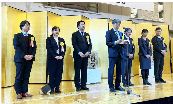
榊原毅厚生労働省大臣官房審議官によるごあいさつ