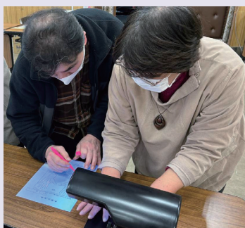
手洗いチェッカーで洗い残しをチェック

新型コロナウイルス感染症の流行が落ち着いた現在、手洗いの習慣が薄れているように思われます。食品衛生の基本は手洗いであることは言うまでもありませんが、今回のように座学だけではなく実習形式を加えることで、より実りのある事業に今後も取り組んでいきたいと思います。