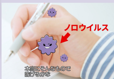
映像は日本語字幕つき

本DVDは弁当製造工場を舞台に、「食中毒」と「感染症」の2つの側面からノロウイルス予防をわかりやすく解説しています。ナレーションや資料映像等を交えて、ノロウイルスの脅威とその防止策を視覚的に理解できる構成とし、従業員研修等に役立つ内容となっています。弁当製造工場の方はもちろん、食品を取り扱うすべての業種の方にご活用いただけます。