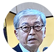
三田芳裕 日食協理事長