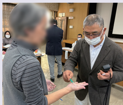
手洗い後のATP検査の様子